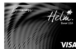
Helm Visa Business