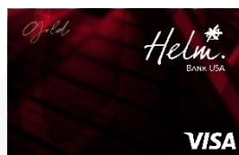
Helm Visa Gold