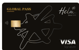
Helm Visa Global Pass